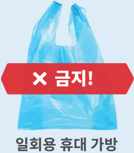
일회용 휴대 가방