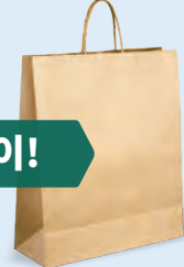
재활용 종이봉투 10¢