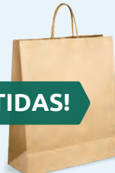
Bolsa de papel reciclable por 10¢